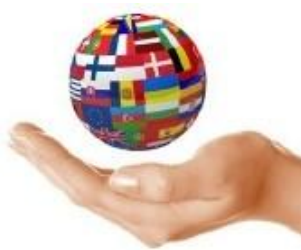
Translated IEEE Xplore tutorials

IEEE는 IEEE Xplore를 효율적으로 사용 할 수 있도록 간략한 개요, IEL검색방법, 최신팁 등의 내용을 4분 미만의 비디오로 제작하여 사용자가 필요한 내용을 선택해서 보실 수 있게 제작하였습니다.